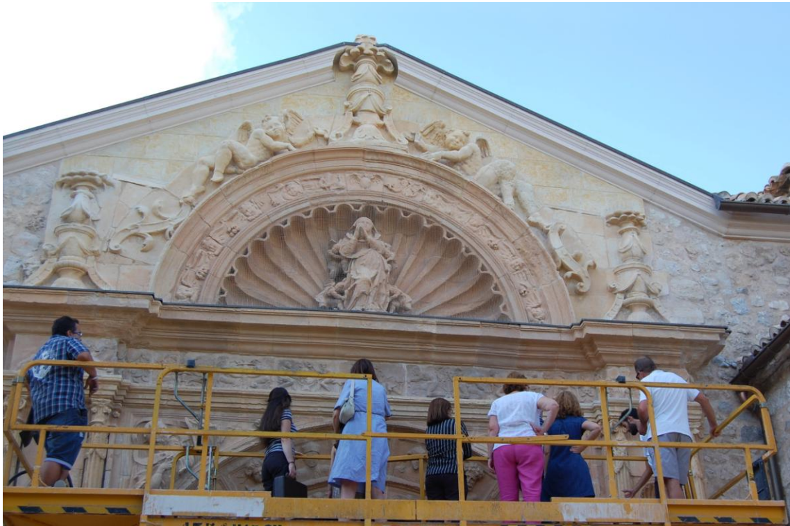
"Subida guiada" sobre la Portada principal de la Iglesia Ntra. Sra. de la Asunción.